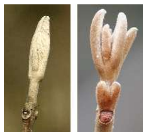
ムラサキシキブ アワブキ

裸芽 若葉の元となる部分に毛が生えていたりしますが、鱗芽 に被われていない冬芽です。コートの要らないような、暖かい 地方の出身だからではないかと考えられています。オニグルミ、 ムラサキシキブ、エゴノキ、ヤマウルシ、クマノミズキ、アカ メガシワ、アワブキなどがあります。