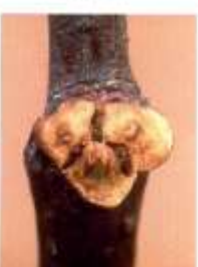
トゲナシニセアカシア