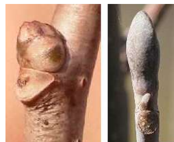
アオハダ コリノキ

鱗芽 若葉の元となる部分が、 がりん 芽鱗と呼ばれるものでお おわれている冬芽です。芽鱗には魚の鱗のようなものか ら、毛皮のコートのようなもの、あるいは硬い皮のジャ ンパーのようなものもあります。クヌギ、コナラ、ソメ イヨシノ、コブシ、ミズキなどがあります。