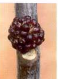
オオバベニガシワ