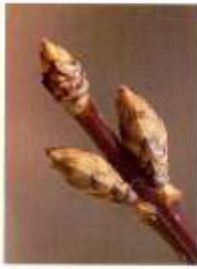
チョウセンレンギョウ